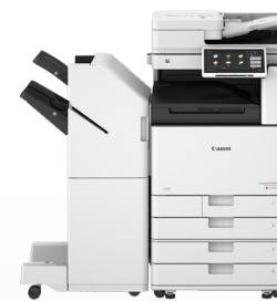
iR ADV DX C3700