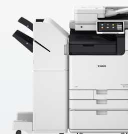
iR ADV DX C5800