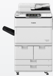
iR ADV DX 6780i