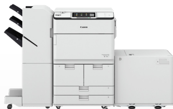
iR ADV DX 8700