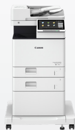
iR ADV DX 717/617/527