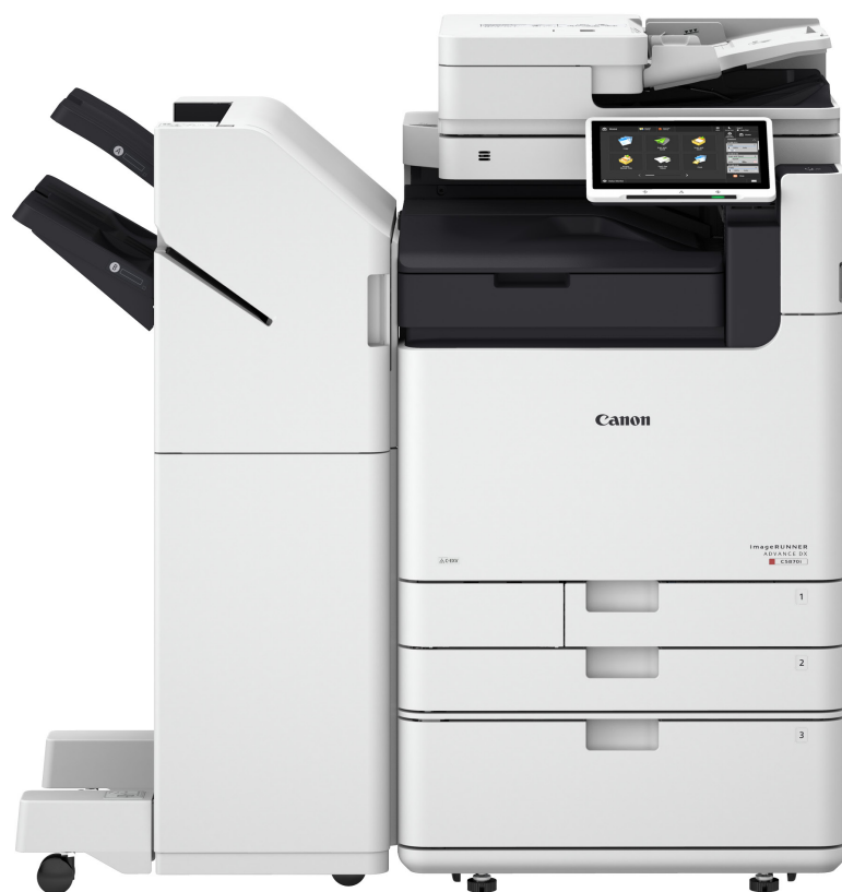
iR ADV DX C5800

Моделите от най-новата серия imageRUNNER ADVANCE C5800 генерират до 18% по-малко CO2 и тежат с 20% по-малко от своите предшественици.