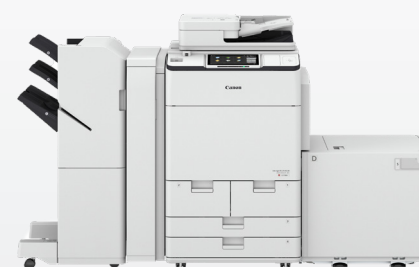
iR ADV DX C7700

Портфолиото на imageRUNNER ADVANCE DX на Canon е проектирано с мисълта за ефективната хибридна работа. Наследявайки характеристиките на многократно награждаваната платформа imageRUNNER ADVANCE от 3-то поколение, портфолиото от интелигентни многофункционални устройства включва най-новите технологии за сканиране и обработка на документи и възрадена усъвършенствана облачна свързаност. Продуктивно, сигурно и свързано, портфолиото imageRUNNER ADVANCE DX ви помага да продължите напред във вашето пътешествие в цифровата трансформация, като безпроблемно интегрирате физически печат и цифрова информация.