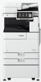
iR ADV DX 4700