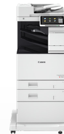
iR ADV DX C478