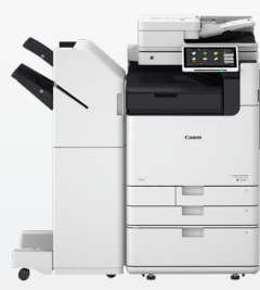
iR ADV DX 6800